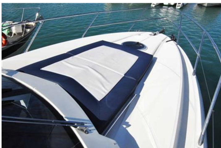
Absolute 40 (5) prendisole prua