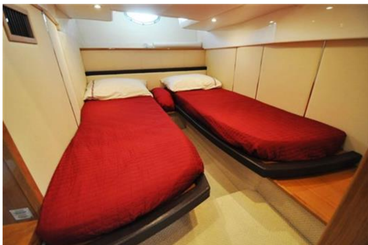
Absolute 40 (20) letti camera ospiti