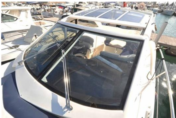
Absolute 40 (6) hard top