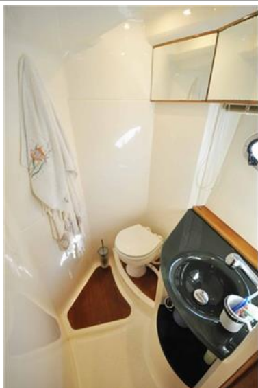
Absolute 40 (21) bagno ospiti