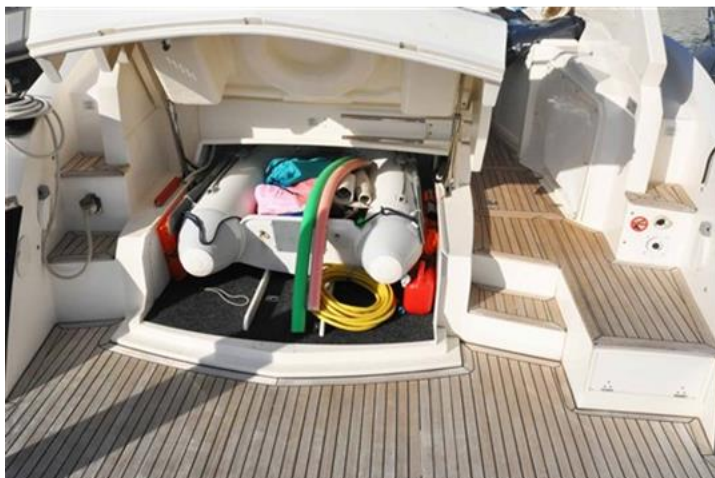
Absolute 40 (22) garage per tender