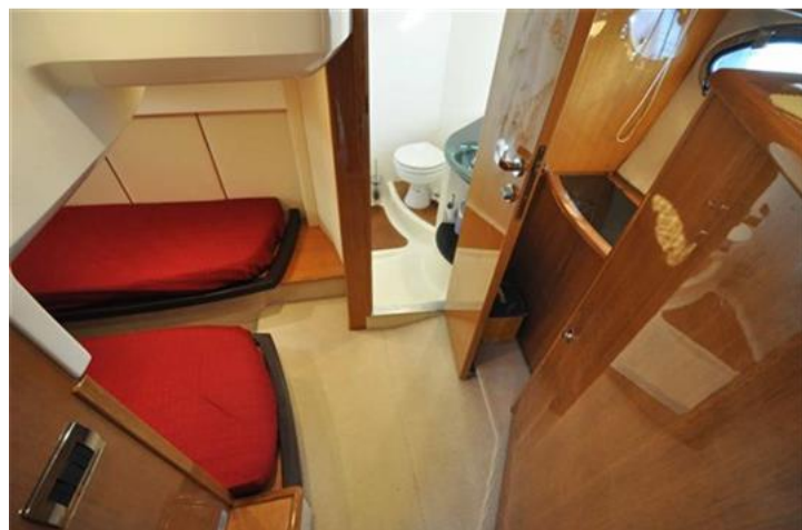
Absolute 40 (19) camera ospiti poppa