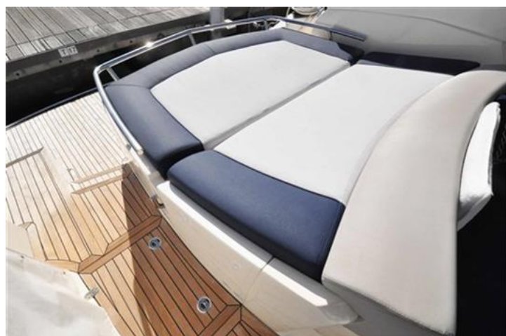
Absolute 40 (7) poppa e plancetta bagno