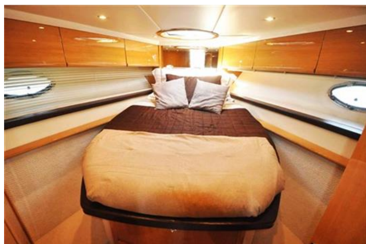
Absolute 40 (17) camera armatore prua