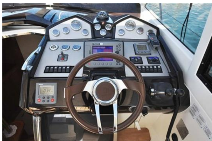
Absolute 40 (11) plancia comando