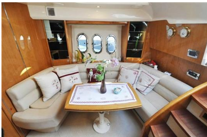
Absolute 40 (14) dinette interna