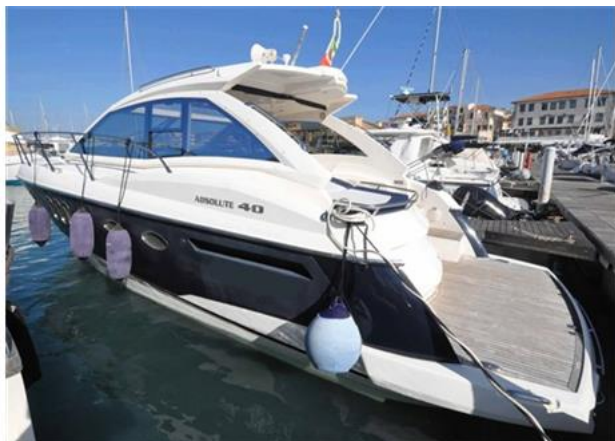
Absolute 40 (2) lato sinistro

Tipo: Hard Top Lunghezza: 12,09 m Motore: Volvo Penta D4-300 Bandiera: Italia Lunghezza F.T.: 12,09 m Potenza: 2 x 300 Hp Costruzione: 2009 Immatricolaz: 2011 Larghezza: 3,95 m Prezzo: 199.000,00 € IVA Pagata Immersione: 1,15 m Ore Moto: 630 Tipo Mot.: Entro Fuori Bordo Turbo Diesel Visibile: Toscana