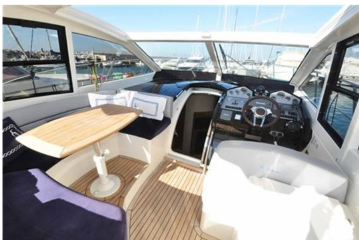
Absolute 40 (9) pozzetto