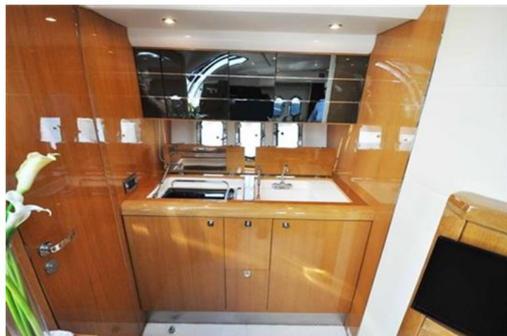
Absolute 40 (15) cucina interna