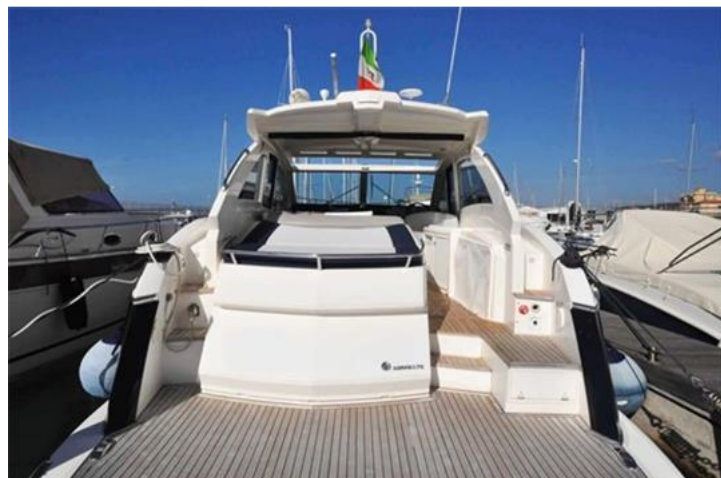
Absolute 40 (3) poppa