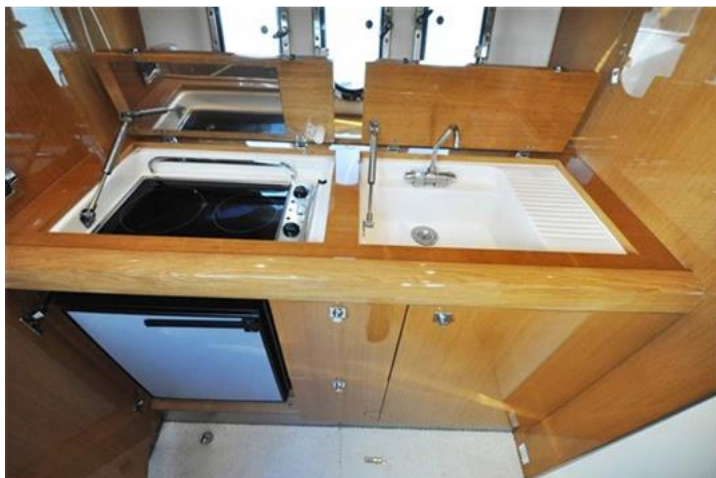
Absolute 40 (16) dettaglio cucina interna