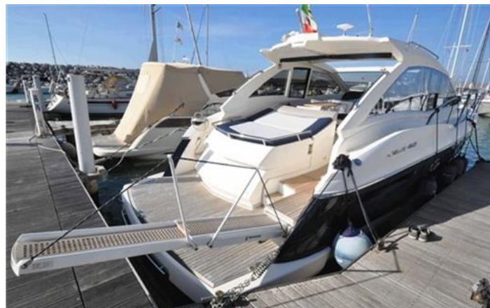
Absolute 40 (1) lato destro