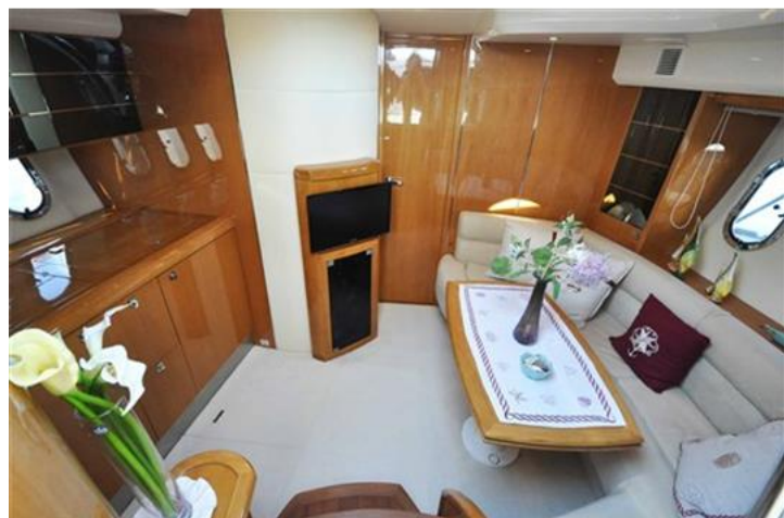
Absolute 40 (13) salone interno