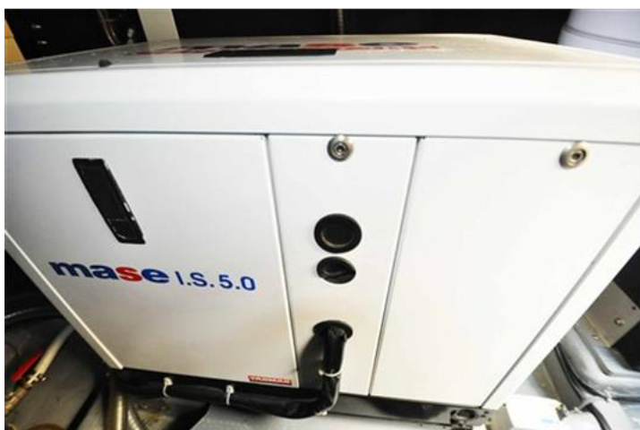
Absolute 40 (24) generatore