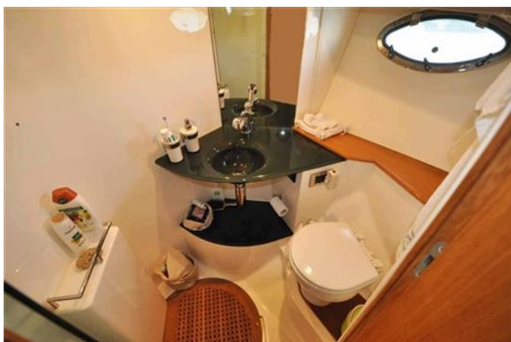
Absolute 40 (18) bagno armatore prua