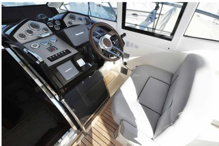
Absolute 40 (10) poltrona comando