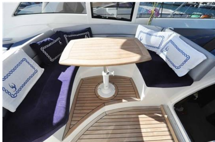
Absolute 40 (8) dinette esterna