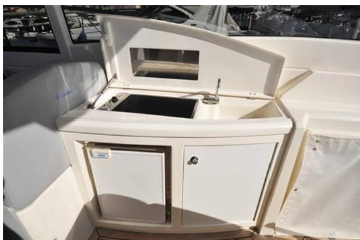
Absolute 40 (12) mobile bar esterno