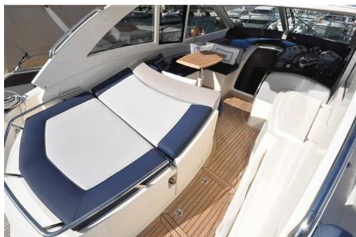
Absolute 40 (4) prendisole poppa