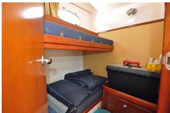
Faeton 1040 Moraga Fly (14)