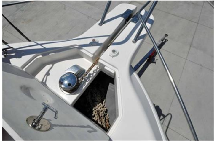
Faeton 1040 Moraga Fly (8)