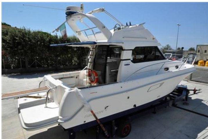
Faeton 1040 Moraga Fly (1)