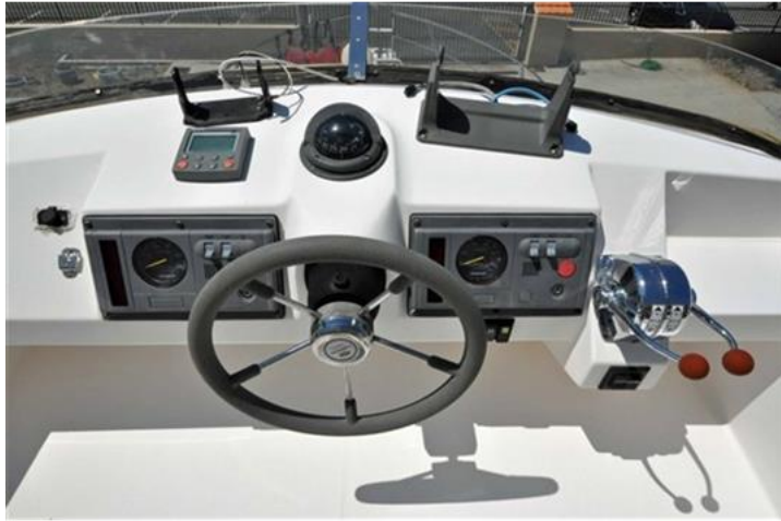
Faeton 1040 Moraga Fly (11)