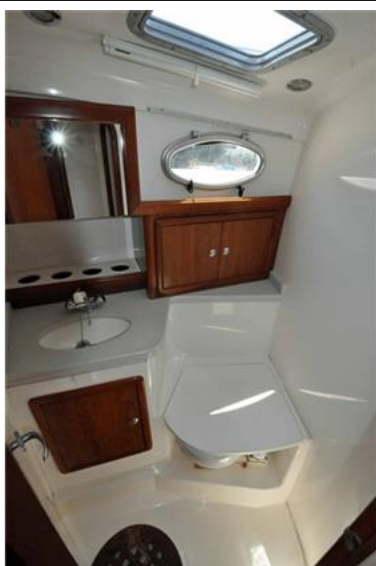
Faeton 1040 Moraga Fly (16)