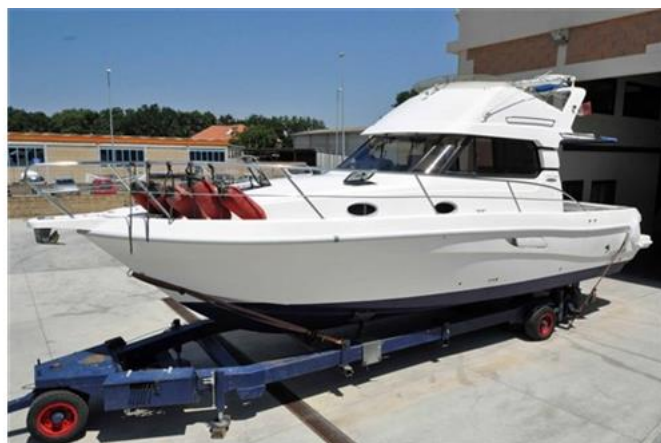
Faeton 1040 Moraga Fly (3)