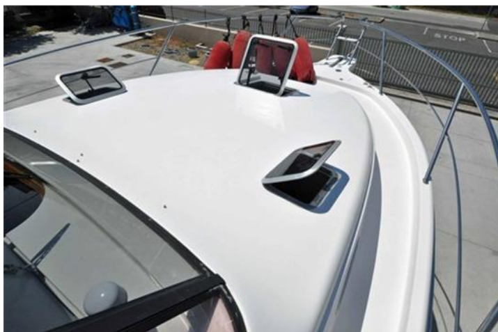
Faeton 1040 Moraga Fly (7)