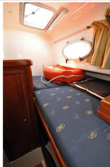
Faeton 1040 Moraga Fly (15)