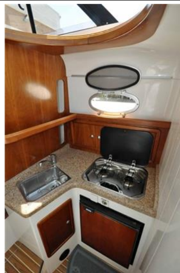
Faeton 1040 Moraga Fly (13)