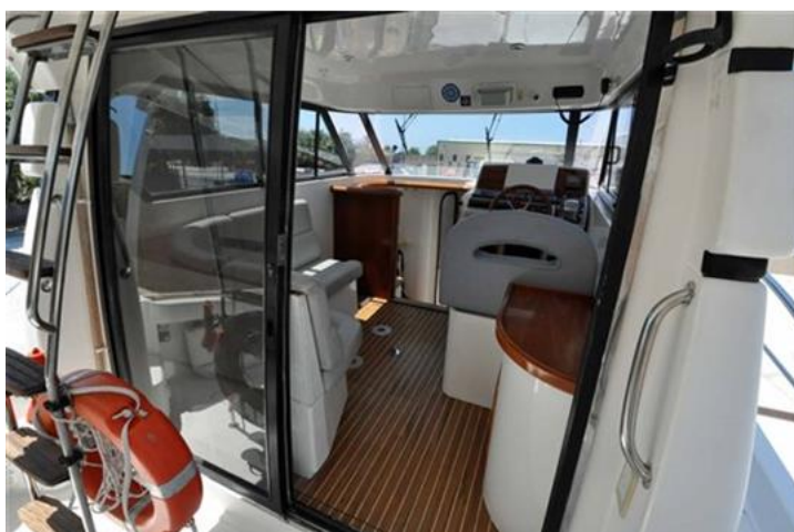
Faeton 1040 Moraga Fly (9)