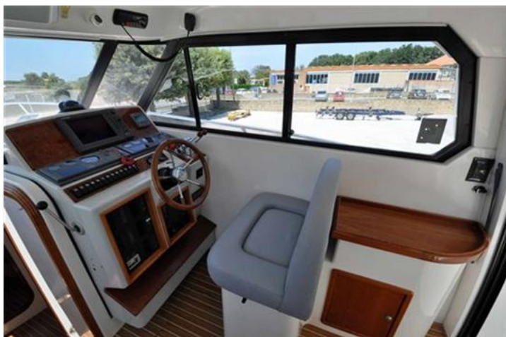
Faeton 1040 Moraga Fly (12)