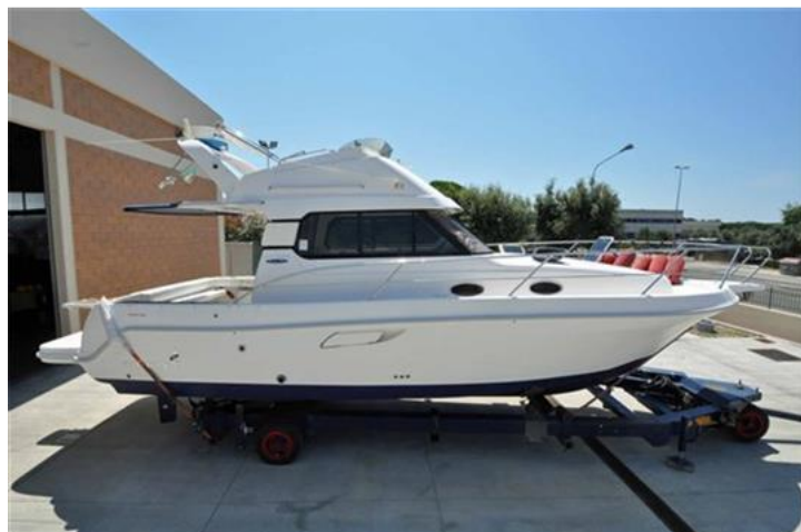
Faeton 1040 Moraga Fly (2)