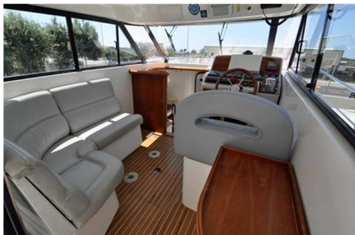
Faeton 1040 Moraga Fly (10)