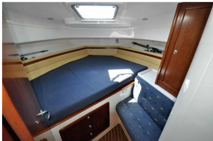
Faeton 1040 Moraga Fly (17)