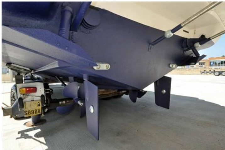
Faeton 1040 Moraga Fly (5)