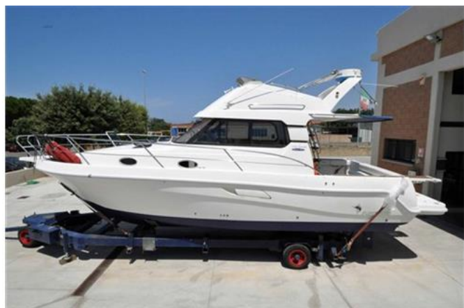
Faeton 1040 Moraga Fly (4)