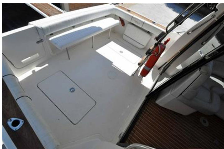
Faeton 1040 Moraga Fly (6)