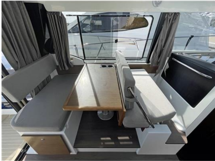
Jeanneau Merry Fisher 1095 (9)