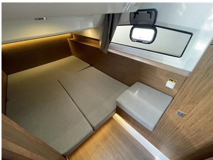
Jeanneau Merry Fisher 1095 (16)