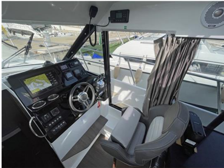
Jeanneau Merry Fisher 1095 (11)