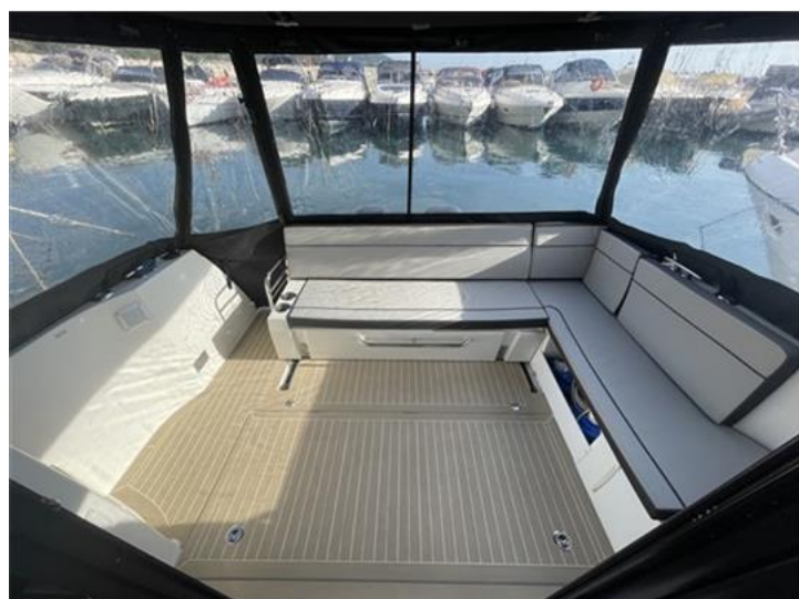
Jeanneau Merry Fisher 1095 (7)