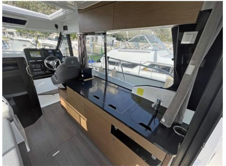
Jeanneau Merry Fisher 1095 (13)