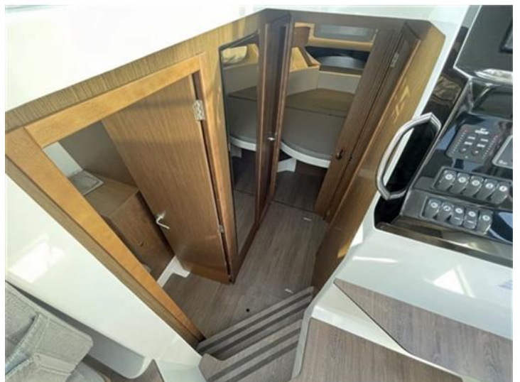
Jeanneau Merry Fisher 1095 (14)