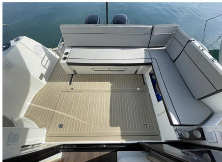
Jeanneau Merry Fisher 1095 (5)