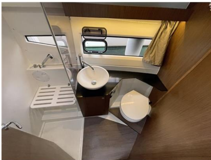
Jeanneau Merry Fisher 1095 (18)