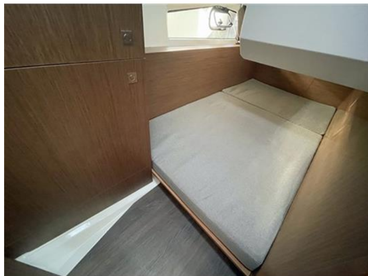
Jeanneau Merry Fisher 1095 (17)