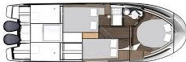
Jeanneau MF 1095 7