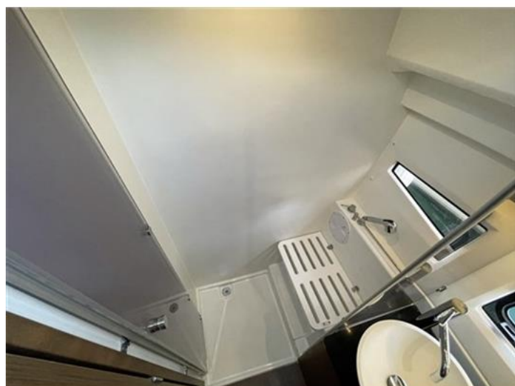
Jeanneau Merry Fisher 1095 (19)