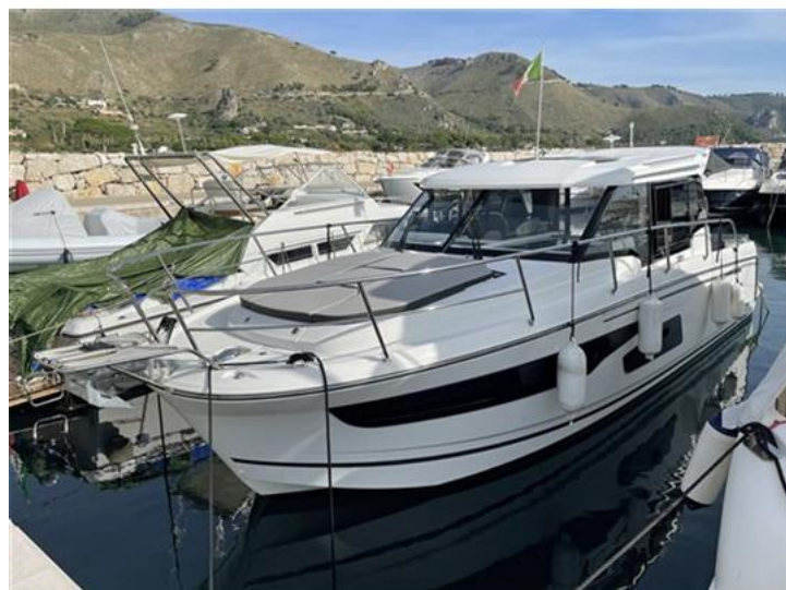
Jeanneau Merry Fisher 1095 (3)