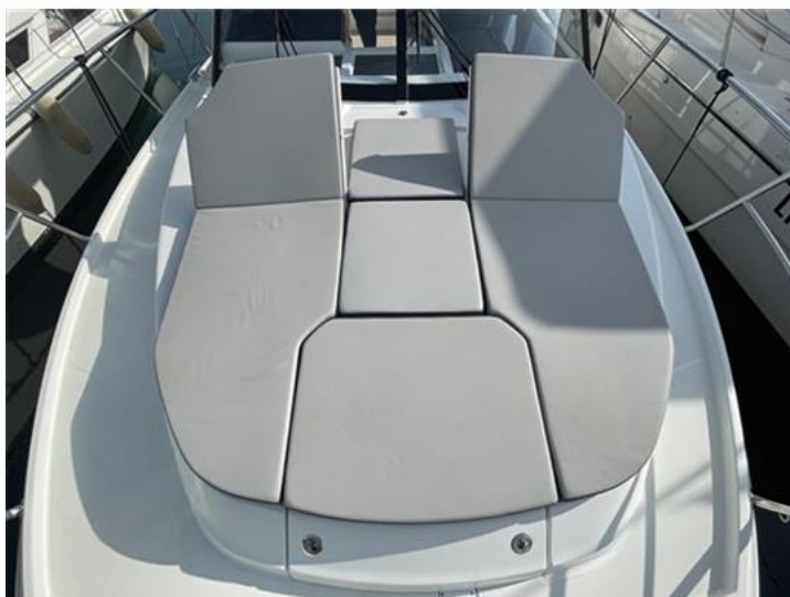
Jeanneau Merry Fisher 1095 (4)