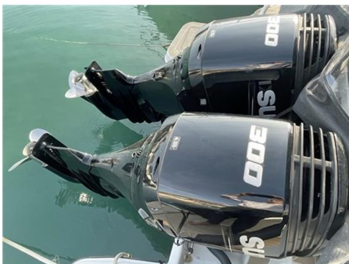
Jeanneau Merry Fisher 1095 (20)