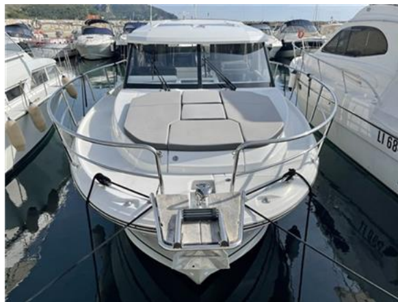
Jeanneau Merry Fisher 1095 (2)