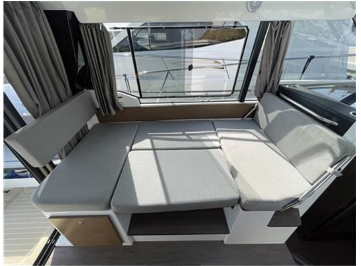
Jeanneau Merry Fisher 1095 (10)