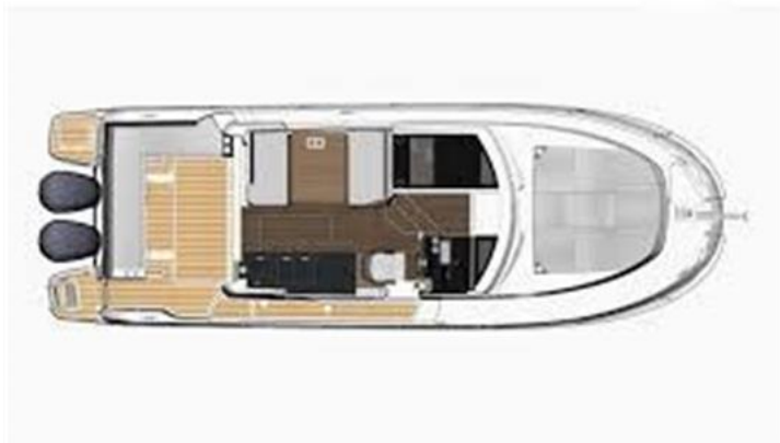
Jeanneau MF 1095 6