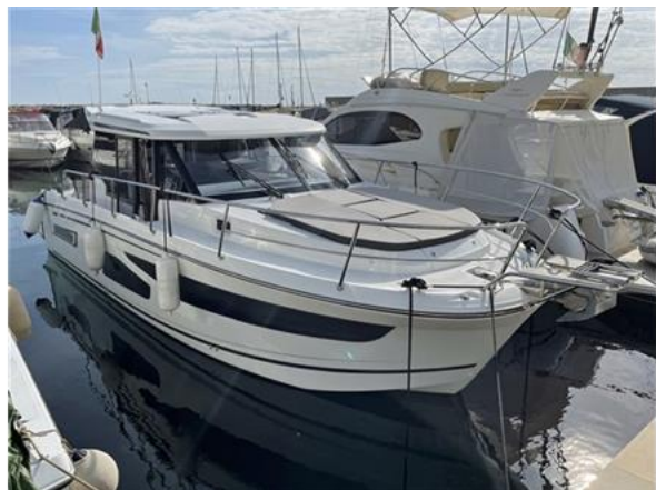
Jeanneau Merry Fisher 1095 (1)