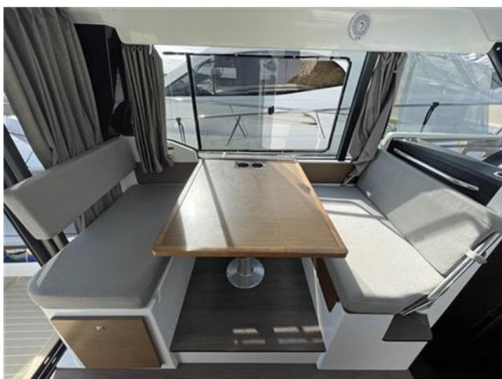
Jeanneau Merry Fisher 1095 (8)