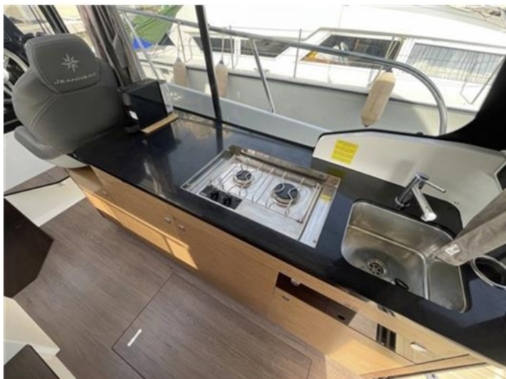
Jeanneau Merry Fisher 1095 (12)