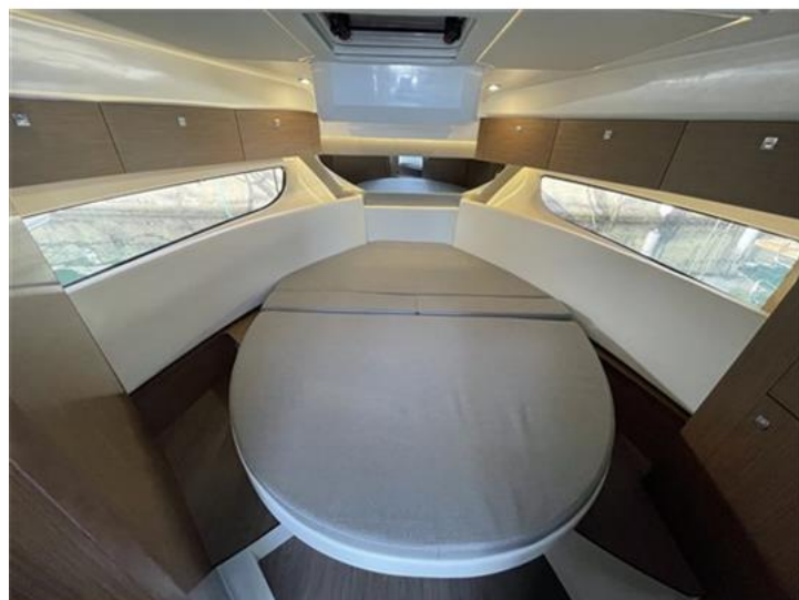
Jeanneau Merry Fisher 1095 (15)