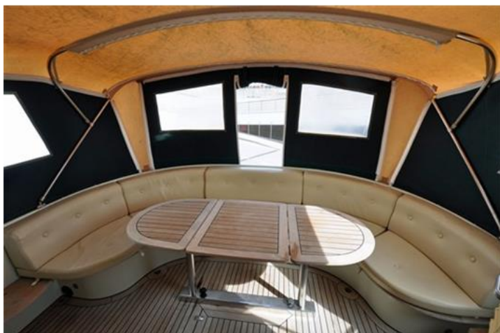
Linssen Grand Sturdy 380 Sedan (6)