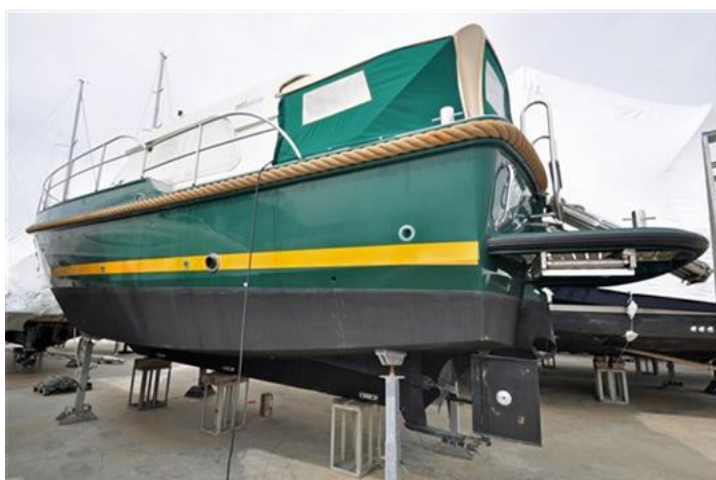
Linssen Grand Sturdy 380 Sedan (1)