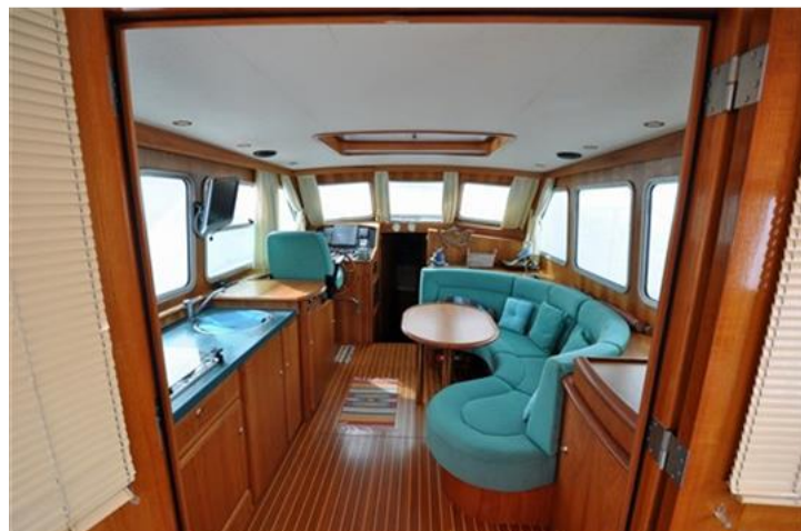
Linssen Grand Sturdy 380 Sedan (8)