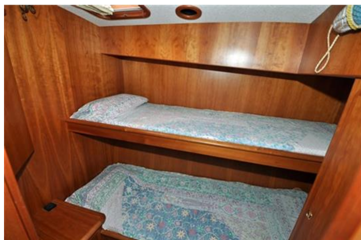
Linssen Grand Sturdy 380 Sedan (15)