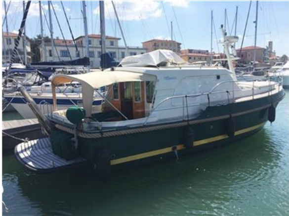
Linssen Grand Sturdy 380 Sedan (22)

Tipo: Navetta Lunghezza: 11,87 m Motore: Volvo Penta D2-75 Bandiera: Belgio Lunghezza F.T.: 11,87 m Potenza: 2 x 75 Hp Costruzione: 2004 Immatricolaz: 2005 Larghezza: 3,85 m Anno Mot.: 2004 Ore Moto: 790 Prezzo 159.000,00 € IVA Pagata Immersione: 1,15 m Tipo Mot.: Entro Bordo Turbo Diesel Visibile: Toscana