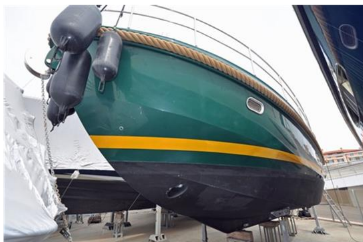
Linssen Grand Sturdy 380 Sedan (4)