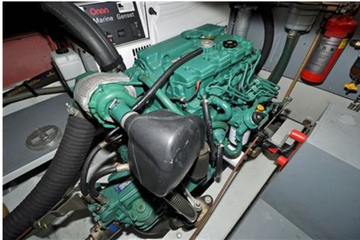
Linssen Grand Sturdy 380 Sedan (21)