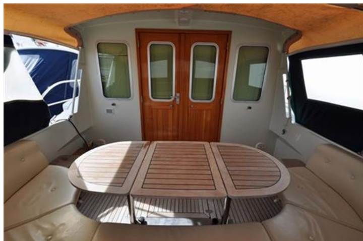
Linssen Grand Sturdy 380 Sedan (7)