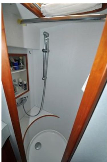
Linssen Grand Sturdy 380 Sedan (16)