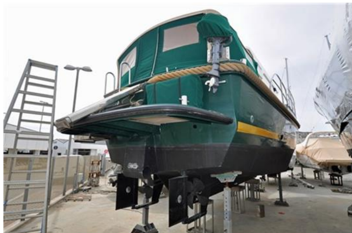
Linssen Grand Sturdy 380 Sedan (2)