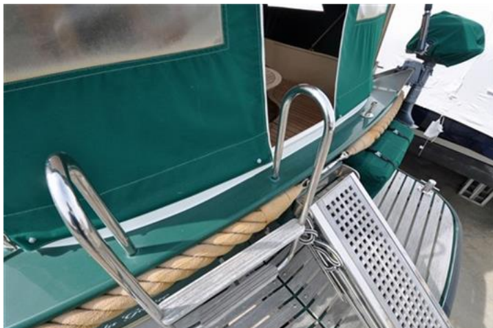
Linssen Grand Sturdy 380 Sedan (5)