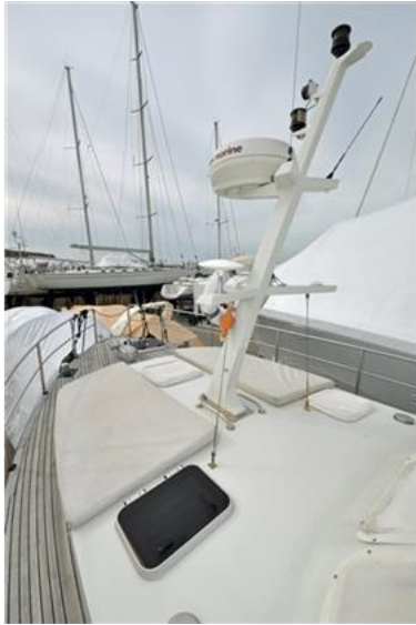
Linssen Grand Sturdy 380 Sedan (19)