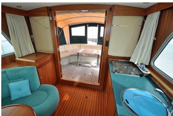
Linssen Grand Sturdy 380 Sedan (9)