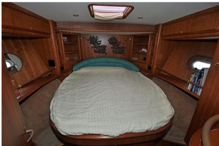
Linssen Grand Sturdy 380 Sedan (18)