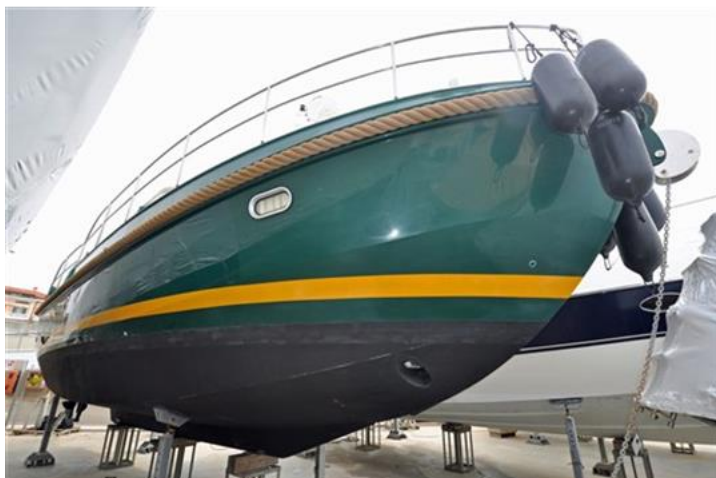
Linssen Grand Sturdy 380 Sedan (3)