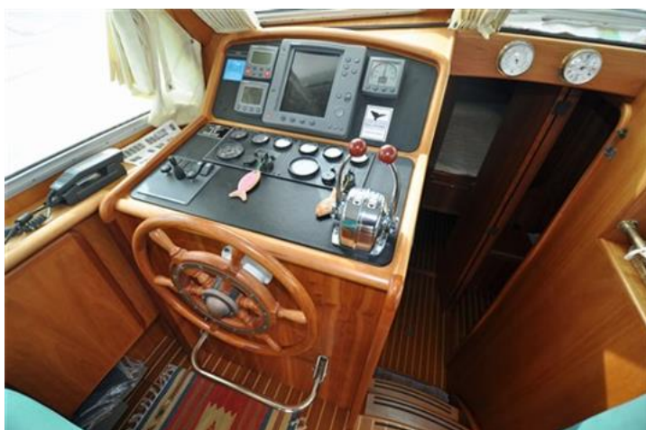
Linssen Grand Sturdy 380 Sedan (14)