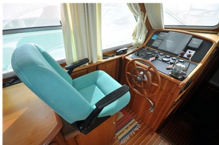
Linssen Grand Sturdy 380 Sedan (13)