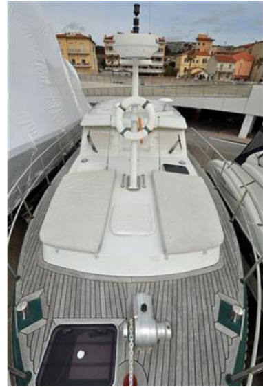
Linssen Grand Sturdy 380 Sedan (20)