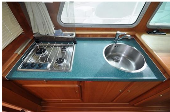
Linssen Grand Sturdy 380 Sedan (12)