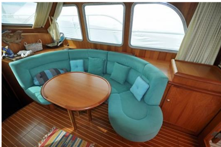
Linssen Grand Sturdy 380 Sedan (11)