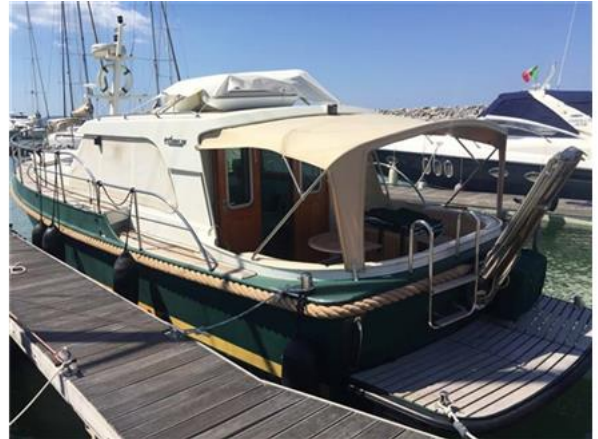
Linssen Grand Sturdy 380 Sedan (23)