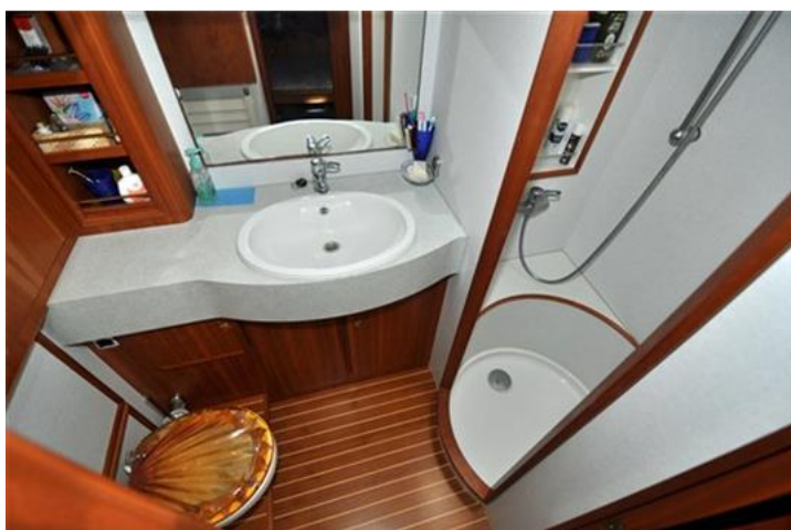
Linssen Grand Sturdy 380 Sedan (17)