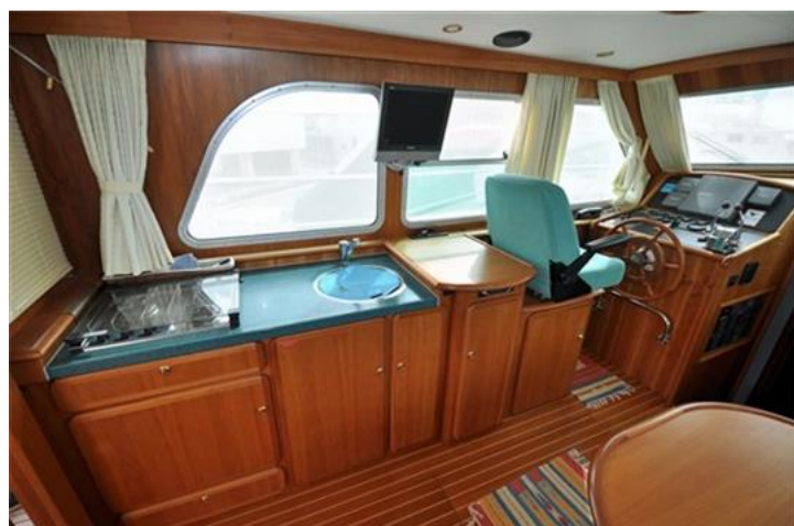
Linssen Grand Sturdy 380 Sedan (10)