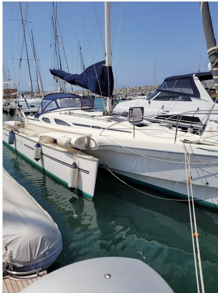
Quorning Boats Dragonfly 35 Offshore