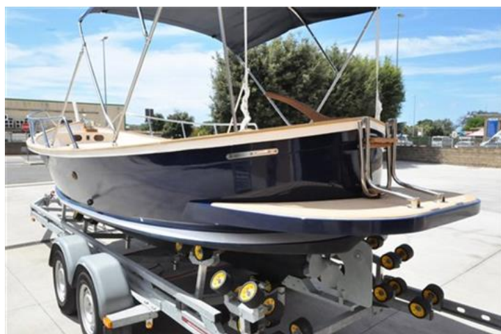
Sciallino 19 (11)