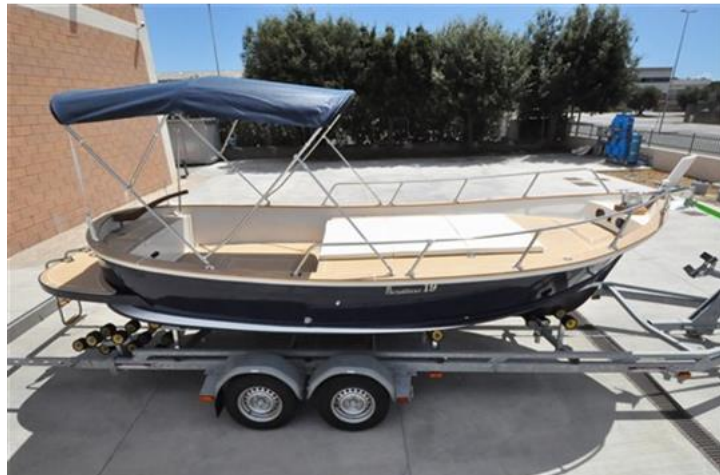
Sciallino 19 (2)