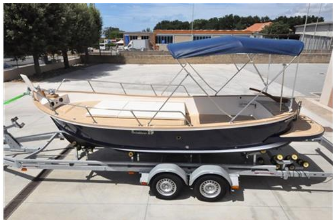
Sciallino 19 (12)