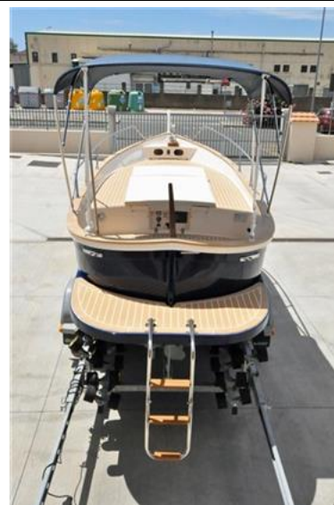
Sciallino 19 (1)