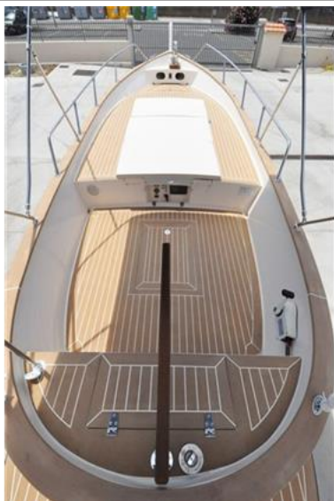
Sciallino 19 (6)