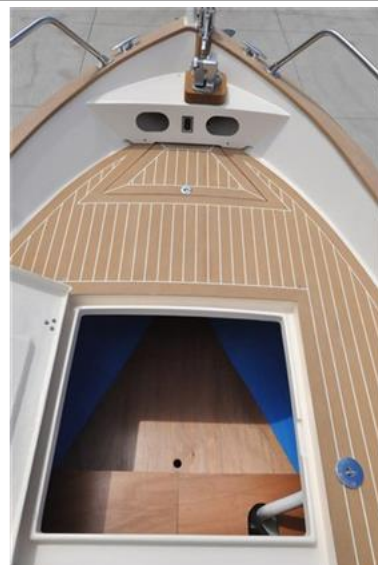
Sciallino 19 (9)