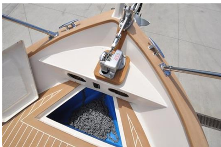
Sciallino 19 (10)