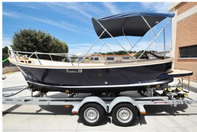
Sciallino 19 (4)