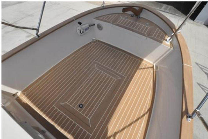
Sciallino 19 (7)