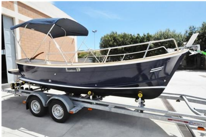
Sciallino 19 (3)