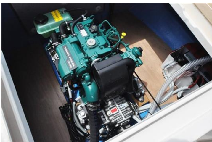
Sciallino 19 (8)