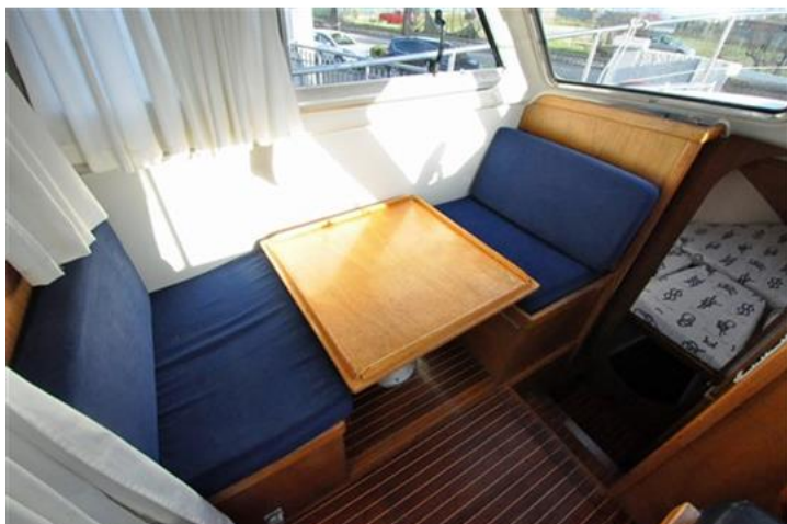
Sciallino 25 (8)