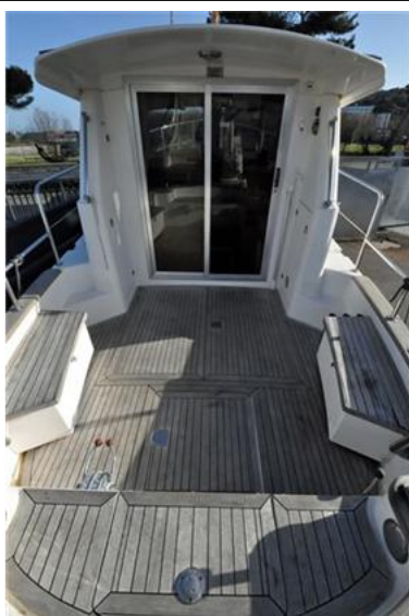
Sciallino 25 (6)