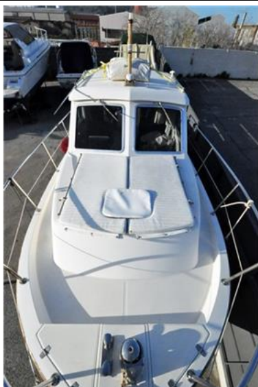
Sciallino 25 (21)