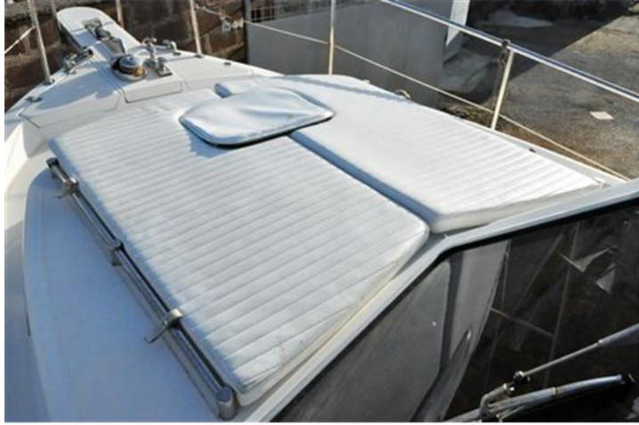
Sciallino 25 (19)