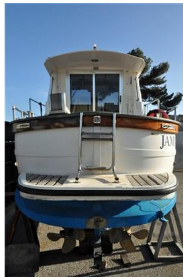
Sciallino 25 (4)