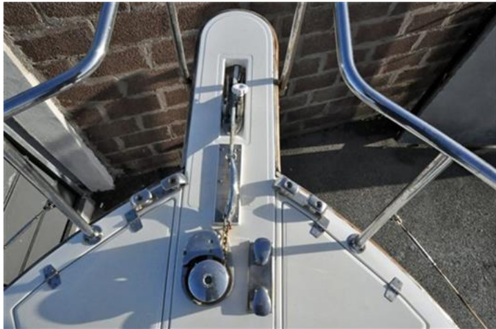
Sciallino 25 (20)