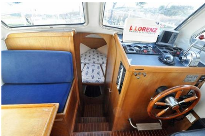
Sciallino 25 (14)