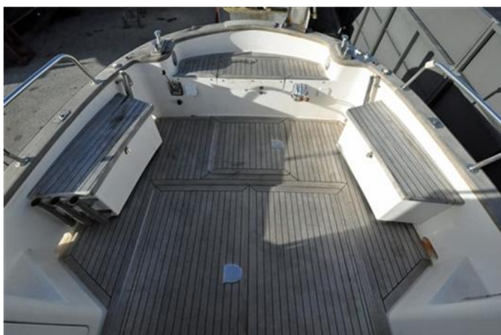
Sciallino 25 (5)