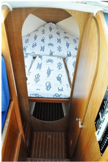
Sciallino 25 (13)