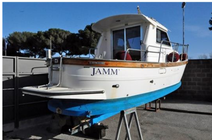
Sciallino 25 (1)