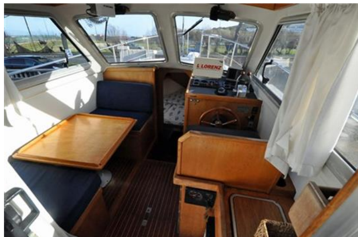
Sciallino 25 (7)