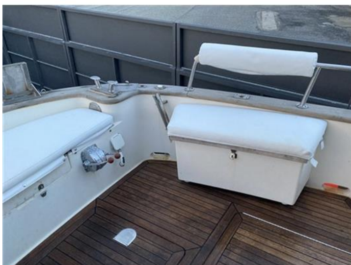
Sciallino 25 (16)