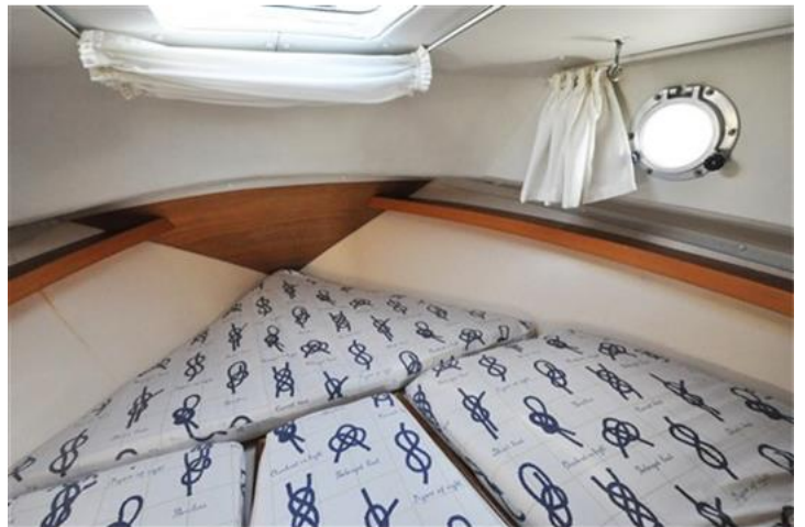
Sciallino 25 (17)