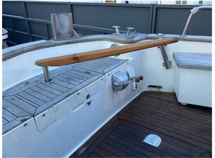
Sciallino 25 (20)