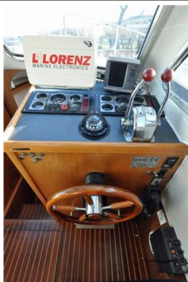
Sciallino 25 (12)