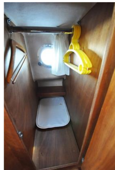
Sciallino 25 (16)