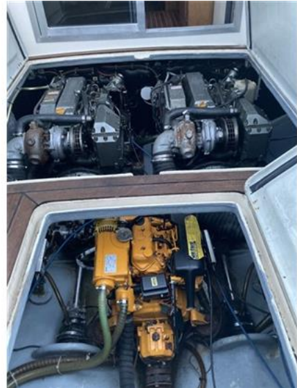
Sciallino 25 (19)