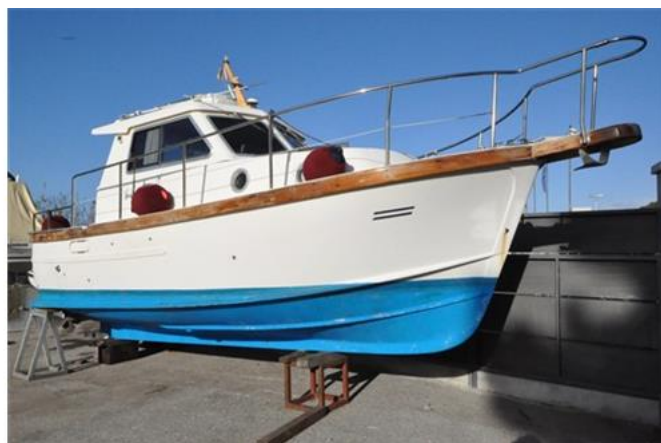
Sciallino 25 (3)