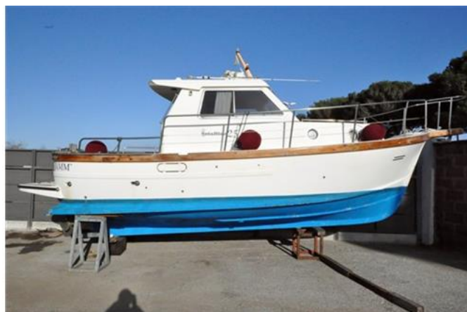
Sciallino 25 (2)