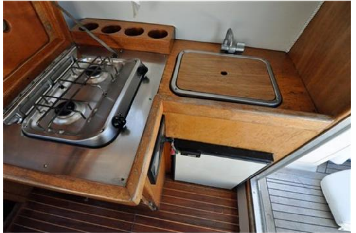
Sciallino 25 (10)