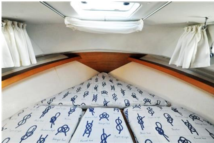
Sciallino 25 (15)