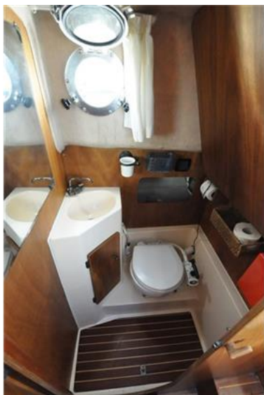
Sciallino 25 (18)