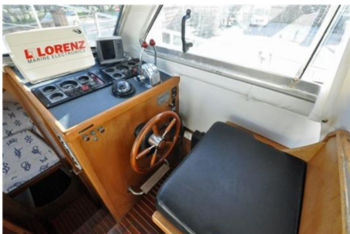
Sciallino 25 (11)