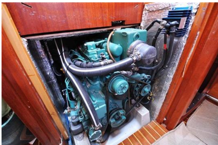
Sweden Yachts 390 (17)