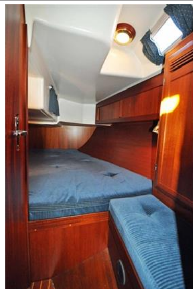
Sweden Yachts 390 (11)