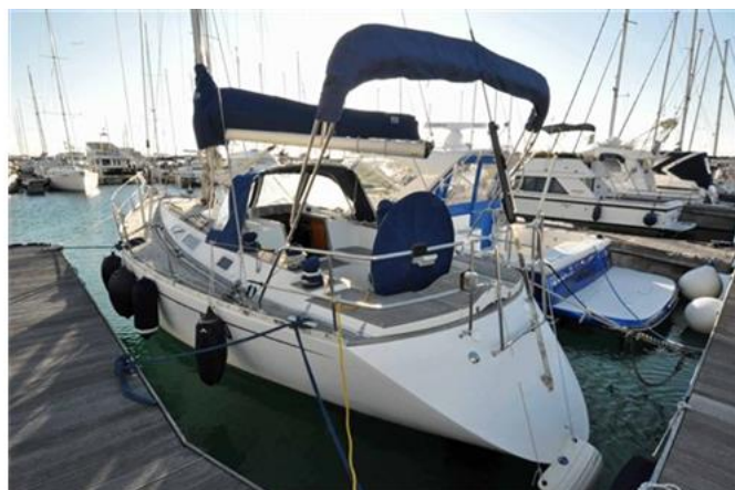
Sweden Yachts 390 (2)