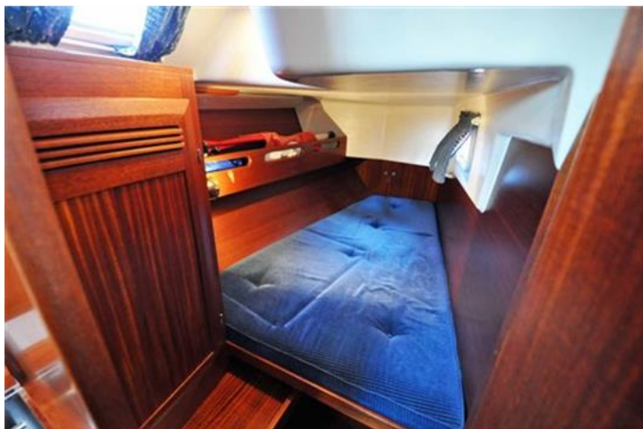
Sweden Yachts 390 (15)