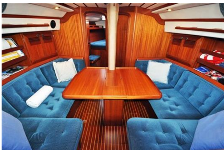
Sweden Yachts 390 (10)