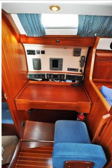
Sweden Yachts 390 (6)