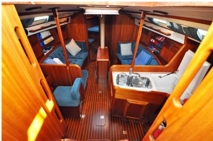
Sweden Yachts 390 (5)