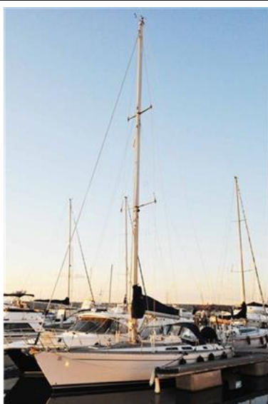
Sweden Yachts 390 (20)