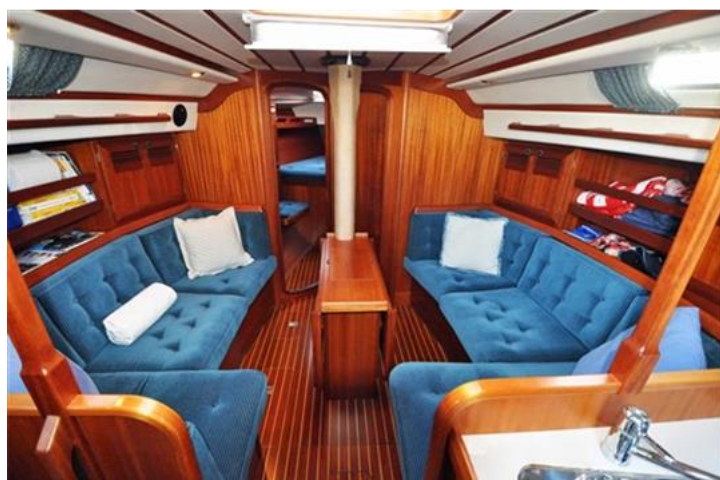
Sweden Yachts 390 (7)