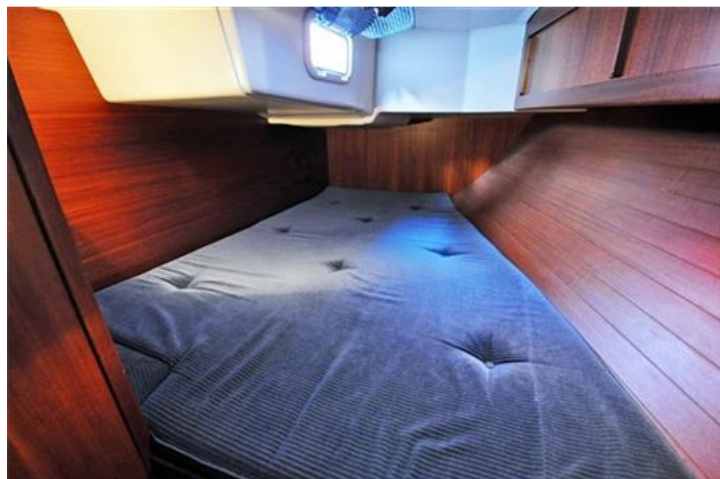
Sweden Yachts 390 (12)