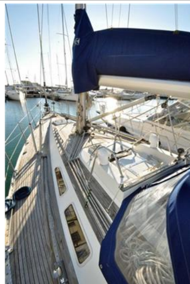
Sweden Yachts 390 (3)