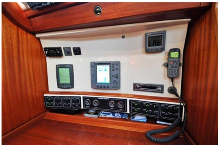
Sweden Yachts 390 (13)