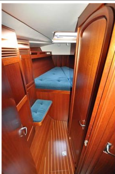
Sweden Yachts 390 (8)