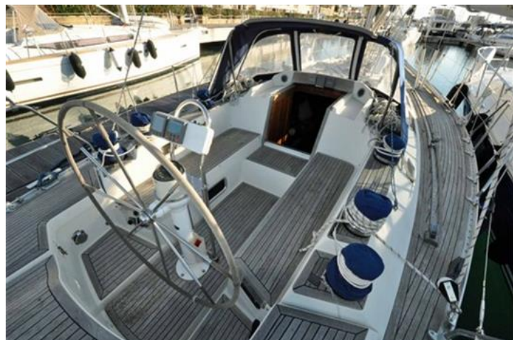
Sweden Yachts 390 (4)