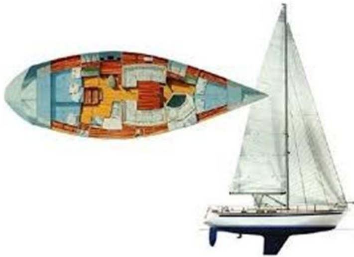
Sweden Yachts 390 (21)