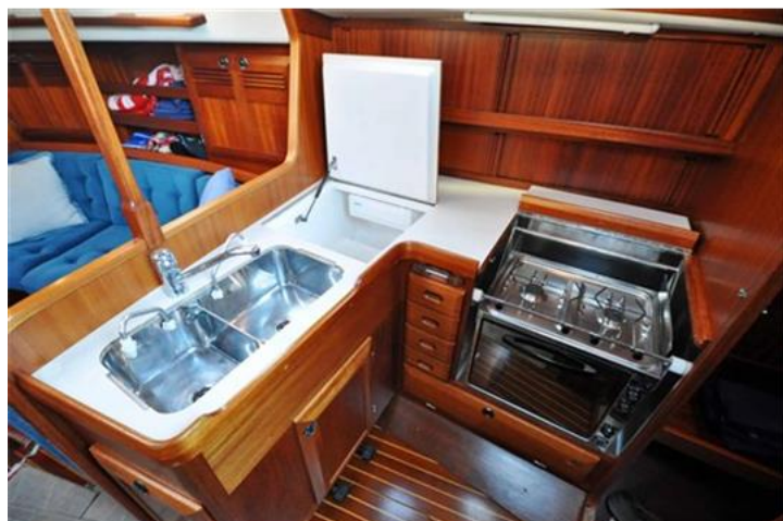
Sweden Yachts 390 (14)