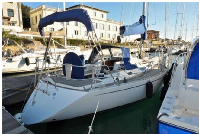
Sweden Yachts 390 (1)