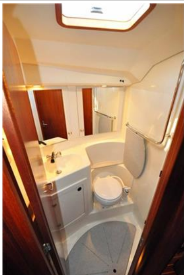
Sweden Yachts 390 (16)