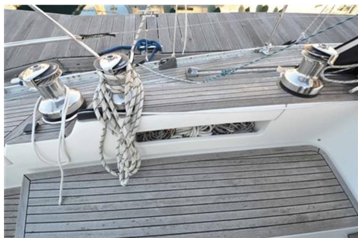
Sweden Yachts 390 (18)