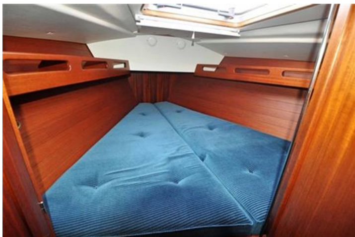
Sweden Yachts 390 (9)